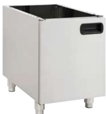
Base 200 για τους κωδικούς Wok 70A, Gas E200, Gas E2