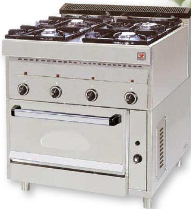
F Gas E4