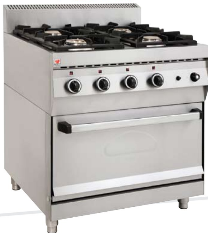
F Gas E400

Gas cooking machines practical and easy in use with single and double burners, they can cope successfully with every demanding cooking. Easy and quick cleaning thanks to the detachable parts and the basin for collecting the residues. The burners as well as the grate are made of cast iron being a guarantee to a long and successful duration. Each machine has in disposal pilot and thermocouple offering protection, security and easy ignition.