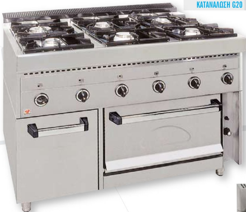
F Gas E6