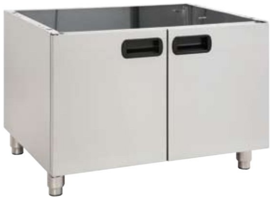
ΒΑΣΗ 700 για τους κωδικούς E400 & E4 ΒΑΣΗ 800 για τους κωδικούς E600 & E6